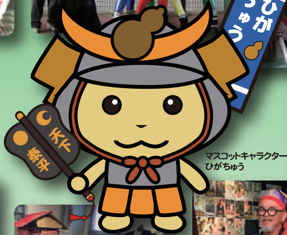
マスコットキャラクター ひがちゆう