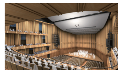
大ホール(客席より)