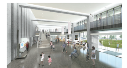
エントランスロビー(南向き)