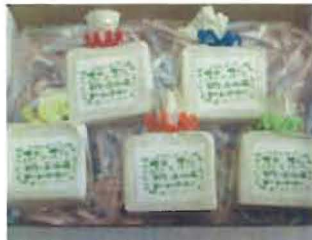
石鹸工房。〇° ぶくぶくの 製品 発送状態です♪ カワイイでしょ！