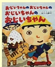
「おじいちゃんのおじいちゃんのおじいちゃんのおじいちゃん」EJ、出版