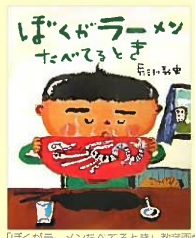
「ぼくがラーメンたへるとき」教育出版