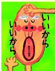
「いいからいいから」絵本館