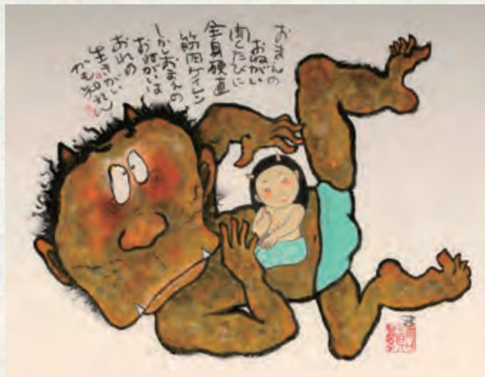
「おまえのおねがい聞くたびに」