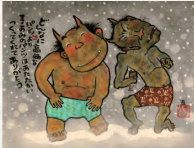
「どんなに高価なパンツより」