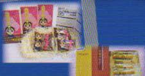
ゆるキャラパッケージの お菓子の詰め合わせ 枚方市 フランス焼き菓子とクッキーの詰め合わせ