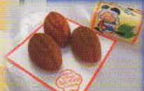
銘菓 東大阪ラグビー 東大阪市 ラグビーボール型の焼菓子12個入