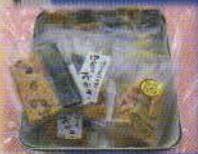
めぐり会いふるさと 四條畷市 手焼きおかきの詰め合わせ