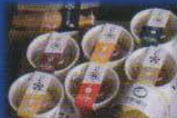
名品なにわら納豆 竹姫納豆セット 大東市 粋・然シリーズより8個