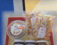
特産品詰め合わせ 精華町 みそ、かきもち、シヤム