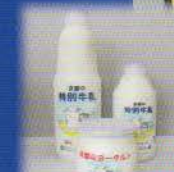
特別牛乳と ヨーグルトのセット 木津川市 特別牛乳900ml 2本、ヨーグルト2個