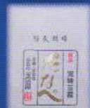
玉露 たなべ 京田辺市 高級玉露80g