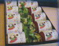
寝屋川銘菓セット 寝屋川市 和菓子の詰め合わせ