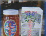
天然無添加 百花はちみつ 交野市 百花はちみつ600g