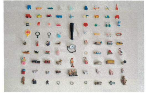
グリコのおもちゃいろいろ(1930~1970年)