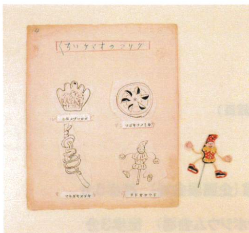
グリコのおもちゃとデザイン画(1935年頃)