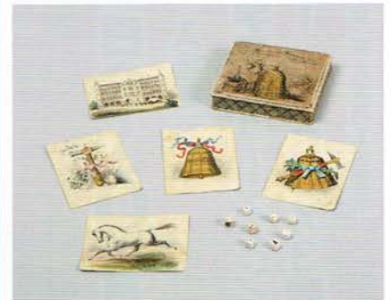
ベル・アンド・ハンマー (中世ヨーロッパ)