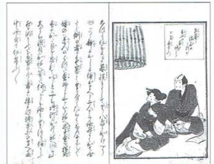
「天地六偽吐」(国会図書館蔵)(江戸時代)

受講料 無料(事前申込制) 時間 午後1時30分～2時30分 申込方法 電話または、FAX、E-mail (以下①～③を明記)にてお申し込みください。定員になり次第締め切ります。 当研究所からの受講許可の連絡はいたしませんので、当日直接会場へお越しください。ただし、定員締め切り後など、受講いただけない場合のみ、その旨ご連絡いたします。 ①氏名 ②住所 ③連絡先(電話/FAX番号、メールアドレス) 申込先・問い合わせ先 大阪商業大学アミューズメント産業研究所 〒577-8505 東大阪市御厨栄町4-1-10 TEL:06(6618)4068 FAX:06(6618)4069 Email: amuse@oucow.daishodai.ac.jp