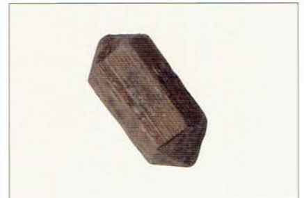
平城京遺跡より出土したサイコロ (奈良市埋蔵文化財センター蔵)