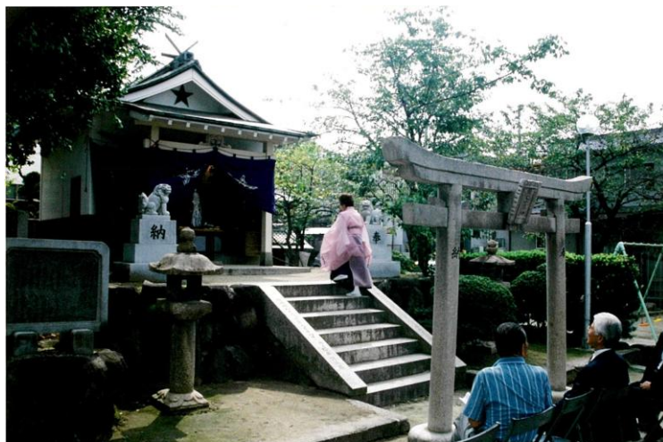
現代も毎年行われる河内額田・陰陽道「歴代組」の祭礼の様子 (陰陽師が祀っていた鎮宅霊符社にて/社殿には陰陽道の祈禱 呪符「五芒星」が見える)