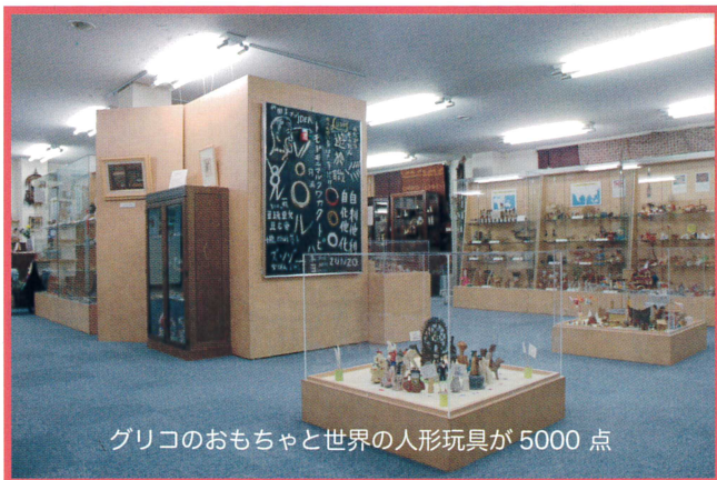
グリコのおもちゃと世界の人形玩具が5000点